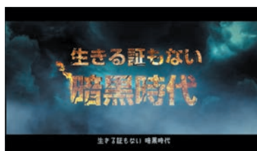
生きる証もない暗黒時代