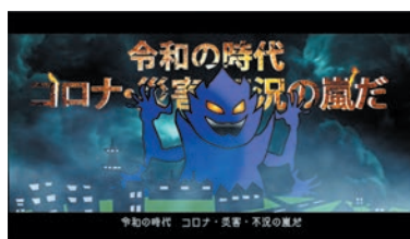
令和の時代 コロナ・災害・不況の嵐だ!