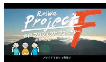
令和 プロジェクトフューチャー! フライドをかけて発信す