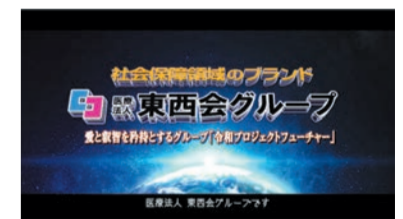
私たちは 社会保険領域のブランド 医療法人東西会グループです!