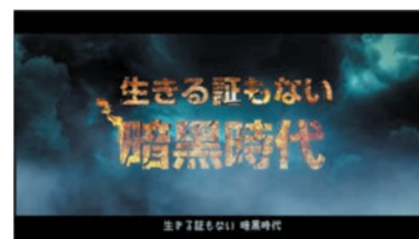
生きる証もない暗黒時代