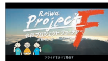
令和 プロジェクトフューチャー! プライドをかけて発信す