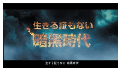
生きる証もない暗黒時代