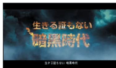
生きる証もない暗黒時代