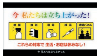
今、私たちは立ち上がった! どんないかせんといけん