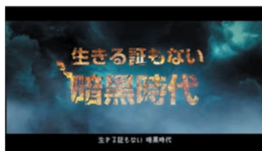
生きる証もない暗黒時代