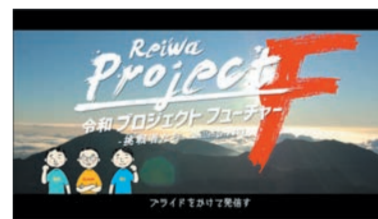
令和 プロジェクトフューチャー! フライドをかけて発信す