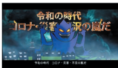
令和の時代 コロナ・災害・不況の嵐だ!