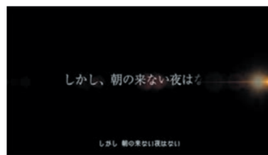
しかし、朝のこない夜はない!