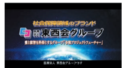
私たちは「社会保障領域のブランド」 医療法人東西会グループです!