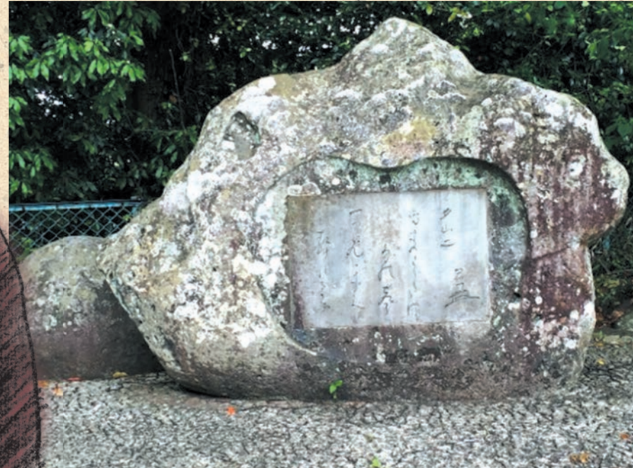
宇和島城・城山公園にある中井コッフ歌碑

これは大正13年静養のため別府鉄輪温泉にいた時の作。天地が今まさに暮れてゆくとする時、それまで鳴き交わしていた何百羽もの鳥の声が次第に少なくなっていく。そして遂に一声になってしまう。その鳥はどのような鳥であろうか。コッフは一人耳を澄ましてそこに言い知れぬ無限の寂寥感を覚える。一羽の鳥の融合した世界、そこにはもう憂がない、体の悪いことさえ忘れたまま大自然に没頭しているのである。