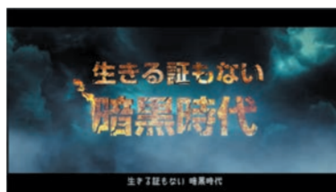
生きる証もない暗黒時代