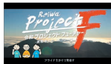
令和 プロジェクトフューチャー! プライドをかけて発信す