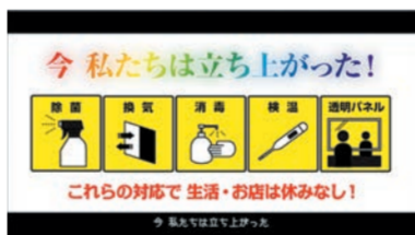
今、私たちは立ち上がった! どんないかせんといけん