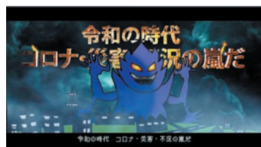
令和の時代 コロナ・災害・不況の嵐だ!