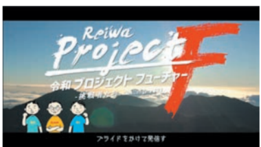
令和 プロジェクトフューチャー! プライドをかけて発信す