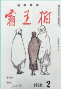
短歌雑誌「霸王樹」 1959年2月号