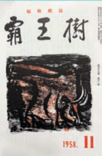
短歌雑誌「霸王樹」 1958年11月号