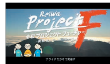
令和 プロジェクトフューチャー! プライドをかけて発信す