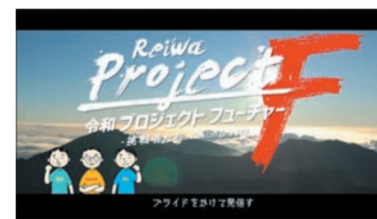
令和 プロジェクトフューチャー! ブランドをかけて発信す