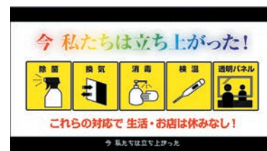
今、私たちは立ち上がった! どんないかせんといけん