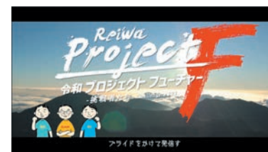
令和 プロジェクトフューチャー! プライドをかけて発信す