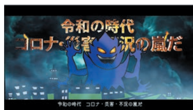
令和の時代 コロナ・災害・不況の嵐だ!