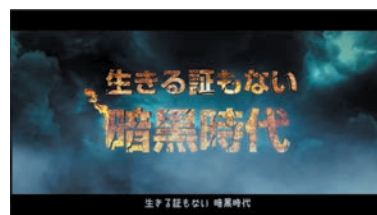
生きる証もない暗黒時代