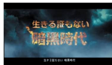
生きる証もない暗黒時代